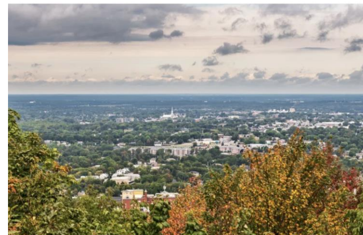
La ville de Victoriaville, ici photographiée depuis le mont Arthabaska.